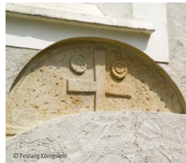
Tympanon se zobrazením kříže, slunce a měsíce

Ve 14. století sestával hradní areál z minimálně tří budov: Císařského hradu, pojmenovaného podle císaře Karla IV. (dnes Hrad Jiřího), domu, ve kterém bydlel purkrabí (dnes Dům velitele) a z hradní kaple (Posádkový kostel). O české minulosti dodnes svědčí v chóru a u jižního vstupu do kostela řada fragmentů nástěnných maleb ze 13. století. Nachází se tam tympanon se zobrazením kříže, slunce a měsíce, což je pro český románský sloh typické. Teprve v roce 1409 se Königstein stává majetkem rodu Wettinů. V Chebské smlouvě z roku 1459 pak byla zakotvena jeho definitivní příslušnost k Sasku.