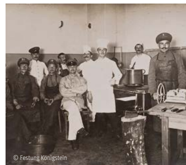
Русские военнопленные во время Первой мировой войны в крепости Кёнигштайн

С 1591 по 1922 г. крепость Кёнигштайн была наводящей ужас государственной тюрьмой, которую называли «саксонской Бастилией». В числе более чем тысячи заключенных, томившихся в ее стенах, был, к примеру, и русский анархист Михаил Бакунин.