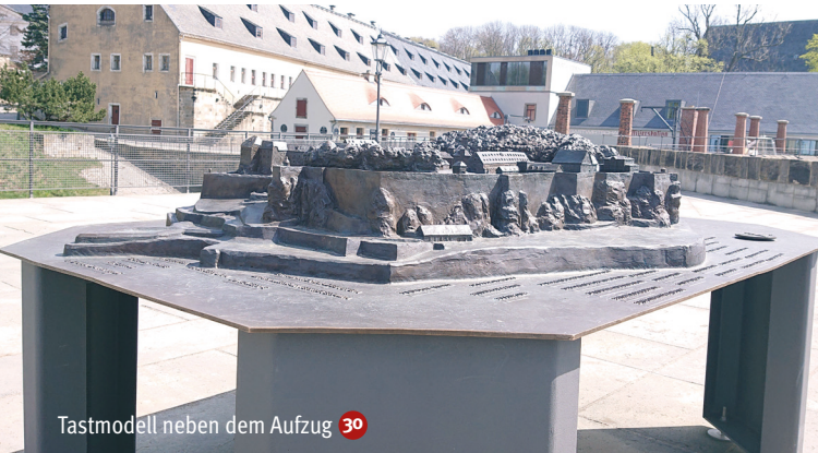
Tastmodell neben dem Aufzug 30

Für Rollstuhlfahrer empfiehlt sich eine Begleitperson, da es auf der Bergfestung teilweise unebene Wege und leichte Steigungen gibt. Die Festungsmitarbeiter unterstützen Sie gern. Bitte sprechen Sie uns an.