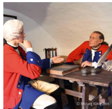
Więzienie państwowe w Zamku Jerzego

Również obydwaj polscy książęta Jakub i Konstanty Sobiescy są na niej odnotowani. Podczas wielkiej wojny północnej August Mocny obawiając się, że szwedzki król Karol XII mógłby pomóc Jakubowi Sobieskiemu – byłemu kontrkandydatowi Augusta do polskiego tronu, zdobyć koronę, schwytał Jakuba i Konstantego w 1704 r. i do 1706 r. więził ich na Königstein. W spisie więźniów odnotowano, iż książęta wraz ze swoją służbą oraz dwoma duchownymi zamieszkiwali zamek Magdaleny, gdzie od czasu do czasu zamieszkiwał również dwór królewski.