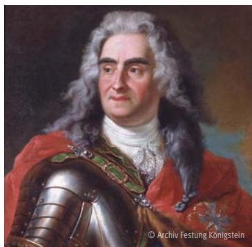
Fryderyk August II, król Polski w latach 1697 – 1706 i 1709 – 1733, elektor Saksonii 1694 – 1733 jako August Mocny

Ponieważ twierdza Königstein uważana była za nie do zdobycia, wierzono, że więźniowie polityczni są tutaj najbezpieczniejsi. Zachowany spis więźniów z lat 1591-1922 zawiera prawie 1000 nazwisk, wśród nich wiele znanych osób, jak chociażby Johann Friedrich Böttger – wynalazca europejskiej porcelany.